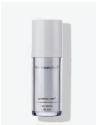
Originalverpackung 50ml Artikelnr.: 5303