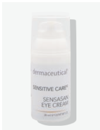
Kabinenverpackung 30ml Artikelnr.: 5402