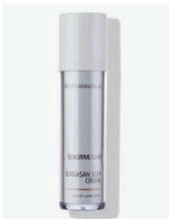
Originalverpackung 50ml ArtikelNr.: 5301