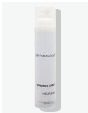
Kabinenverpackung 100ml ArtikelNr.: 5400