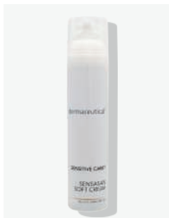
Kabinenverpackung 100ml ArtikelNr.: 5401