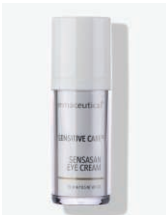
Originalverpackung 15ml Artikelnr.: 5302