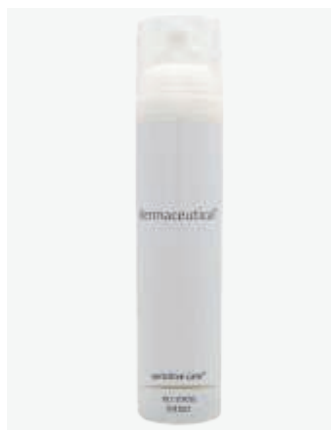
Kabinenverpackung 100ml Artikelnr.: 5403