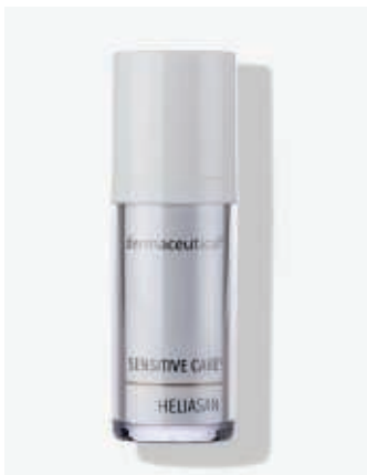
Originalverpackung 30ml ArtikelNr.: 5300