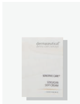
Probe 5ml ArtikelNr.: 5301P