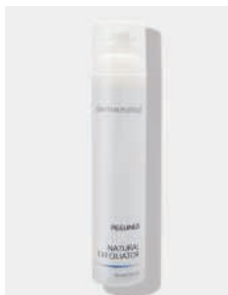
Kabinenverpackung 100ml ArtikelNr.: 1616