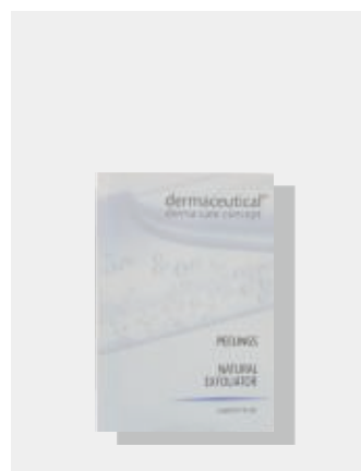
Probe 5ml ArtikelNr.: 1008P