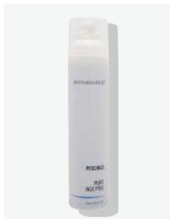
Kabinenverpackung 100ml ArtikelNr.: 1619