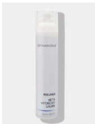
Kabinenverpackung 100ml ArtikelNr.: 1617