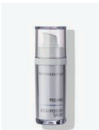
Originalverpackung 30ml ArtikelNr.: 1007