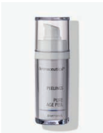
Originalverpackung 30ml ArtikelNr.: 1006