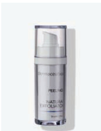
Originalverpackung 30ml ArtikelNr.: 1008