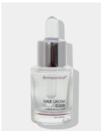
Originalverpackung 15ml Artikelnr.: 1055