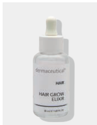
Kabinenverpackung 50ml Artikelnr.: 1055P