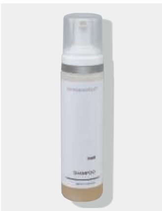
Originalverpackung 200ml ArtikelNr.: 1050