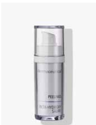
Originalverpackung 30ml ArtikelNr.: 1007