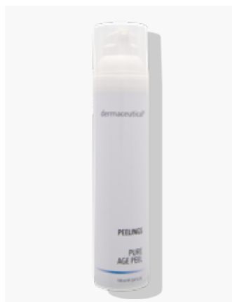
Kabinenverpackung 100ml ArtikelNr.: 1619