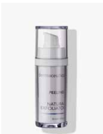
Originalverpackung 30ml ArtikelNr.: 1008