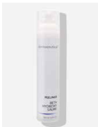
Kabinenverpackung 100ml ArtikelNr.: 1617