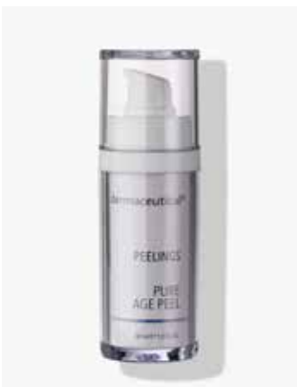
Originalverpackung 30ml ArtikelNr.: 1006