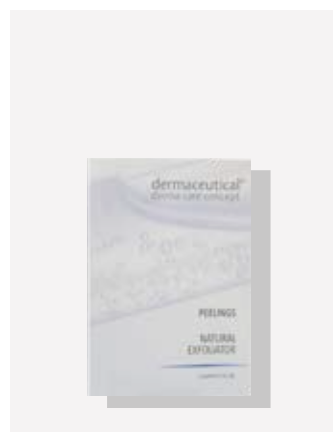
Probe 5ml ArtikelNr.: 1008P