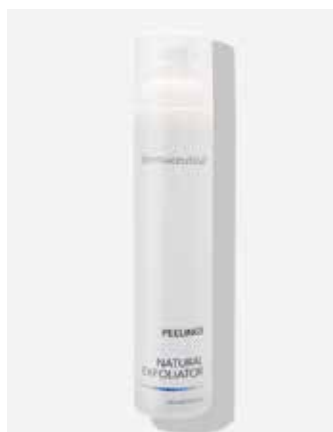
Kabinenverpackung 100ml ArtikelNr.: 1616