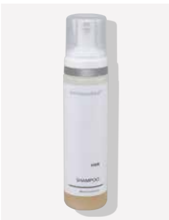
Originalverpackung 200ml ArtikelNr.: 1050