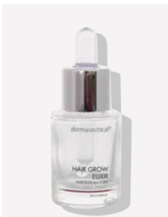
Originalverpackung 15ml Artikelnr.: 1055