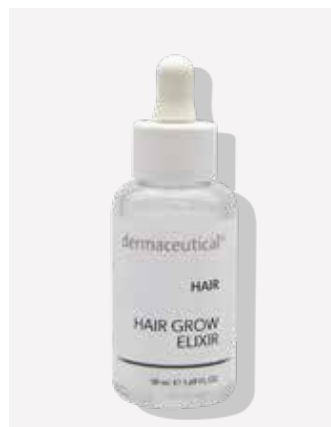
Kabinenverpackung 50ml Artikelnr.: 1055P